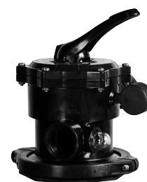
KV TA 2